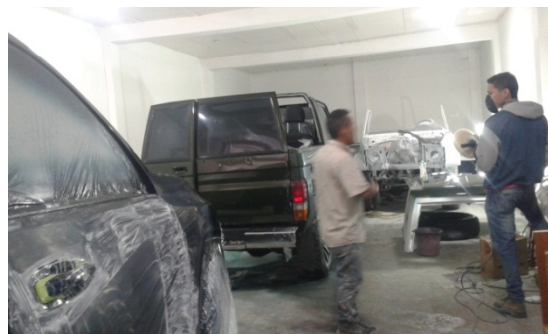
FOTOGRAFÍA 4. ÁREA DE LIJADO Y PINTURA