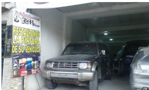
FOTOGRAFÍA 3. INTERIOR DEL PREDIO