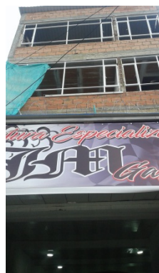
FOTOGRAFÍA 2. FACHADA DEL PREDIO