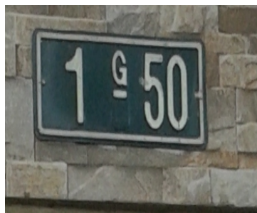
FOTOGRAFÍA 1. NOMENCLATURA